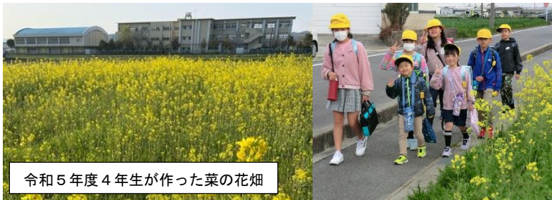
令和5年度4年生が作った菜の花畑