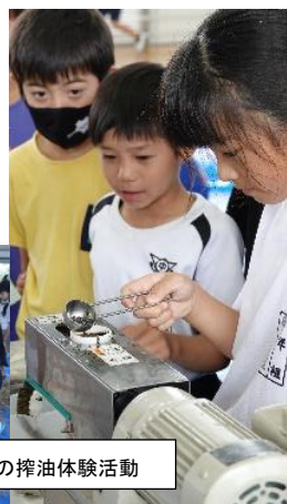
6月菜種油の搾油体験活動