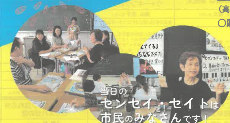
当日のセンセイ・seitは市民のみなさんです！

会場 高知県立 室戸高等学校 (高知県室戸市室津 221) ○駐車場あり ○給食販売あり