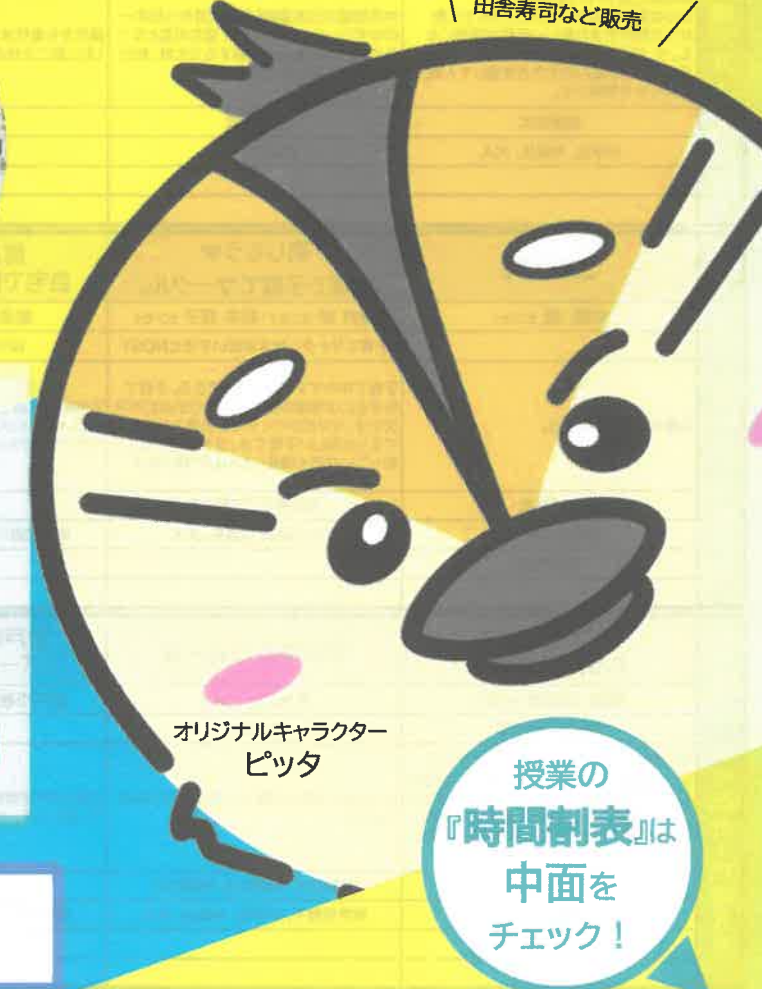
オリジナルキャラクター ピッタ

通称「サマセミ」は、誰でもセンセイ、誰でもseitになれる学校ごっこ。モデルとなった尼崎市に協力をいただき、2023年8月27日に四国初の学びの夏祭りを室戸高校で開催しました。あなたもセンセイ、seitになって、楽しい学びの場を始めませんか！